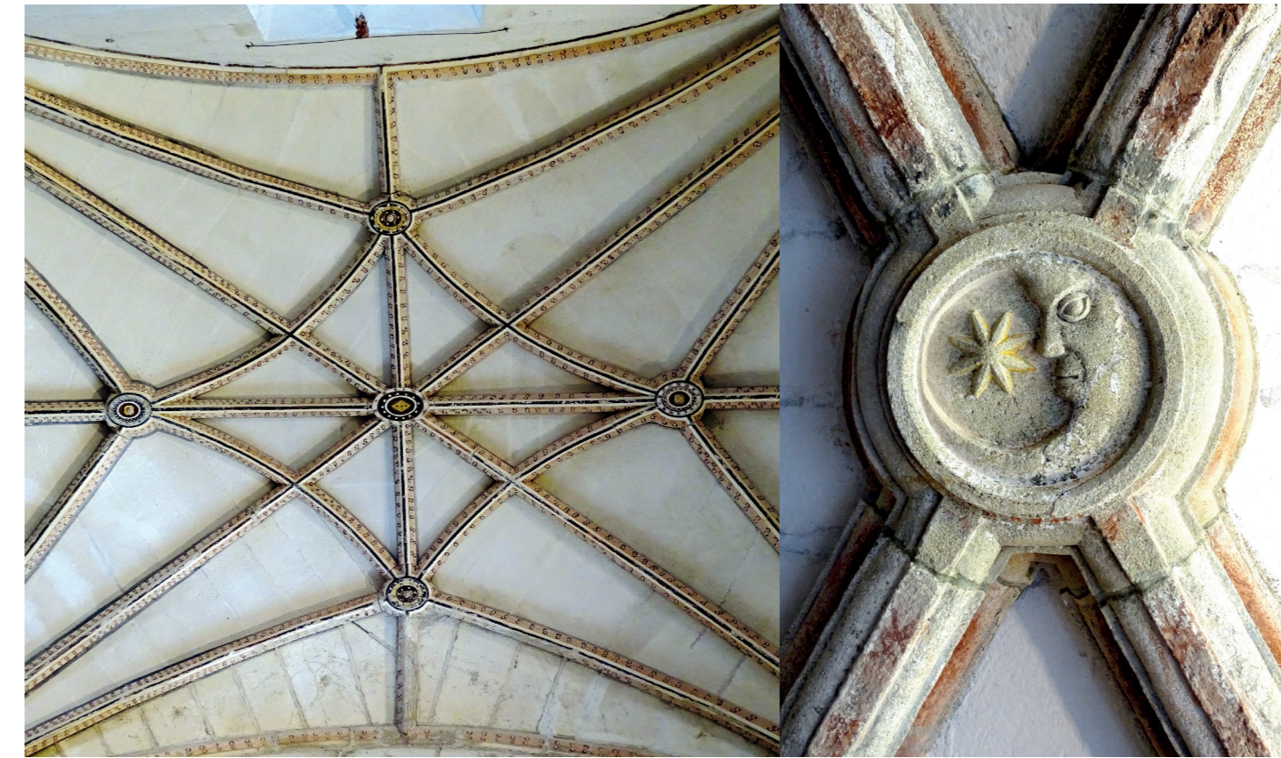
Cúpula nervada do presbiterio